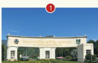
CỔNG CHÀO VƯỜN QUỐC GIA PREAH MONTIVONG