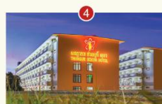
KHÁCH SẠN THANSUR SOKHA