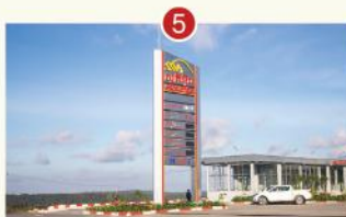
CỬA HÀNG XĂNG DẦU SOKIMEX "TRÊN NÚI BOKOR"