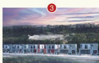
DỰ ÁN THỨ 2 "MOROKOT THANSUR"