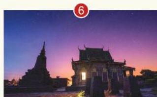
CHÙA NĂM THUYỀN