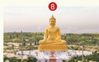
TƯỢNG PHẬT CAO 108 MÉT