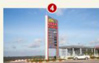
ស្ថានីយស្នាក់ម៉ឺន " លើភ្នំបូកគោ "