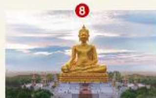
ព្រះពុទ្ធប្បដិមាកម្ពស់ ១០៨ម៉ែត្រ