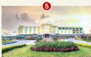
សាលាធានា ឋានសួគ៌ សុខា