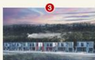
គម្រោងទី២ " បុរីមរកត ឋានសួគ៌ "