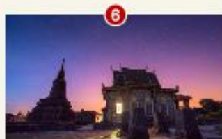
វត្តសំពៅត្រាំ