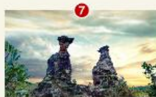
ខ្លោងទ្វារមេឃ