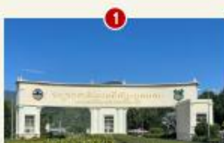
ផ្លូវចូលឧទ្យានជាតិព្រះមុនីវង្ស " បូកគោ "